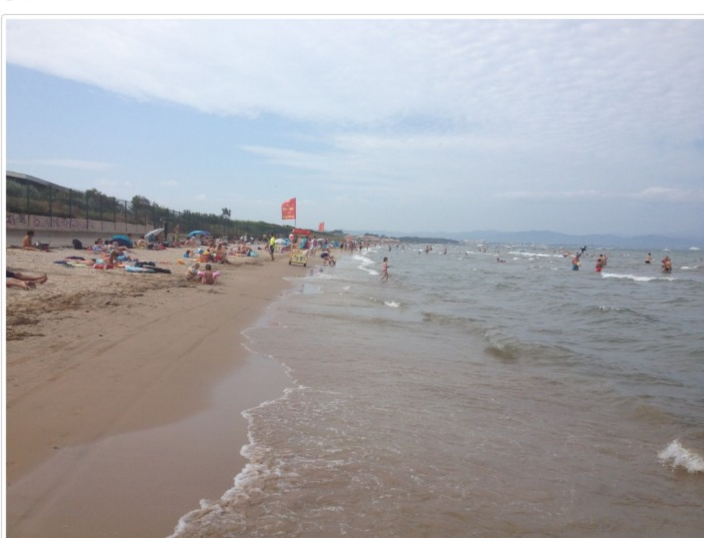
Stranden var lång, sandig och härligt långgrund!

Centret i sig låg mellan Glens och Hyères längs med Franska Rivieran, mellan Nice och Marseille. Med bara några meter ner till havet blev det en och annan promenad längs med stranden och det var flera som var ute och sprang på morgonen.