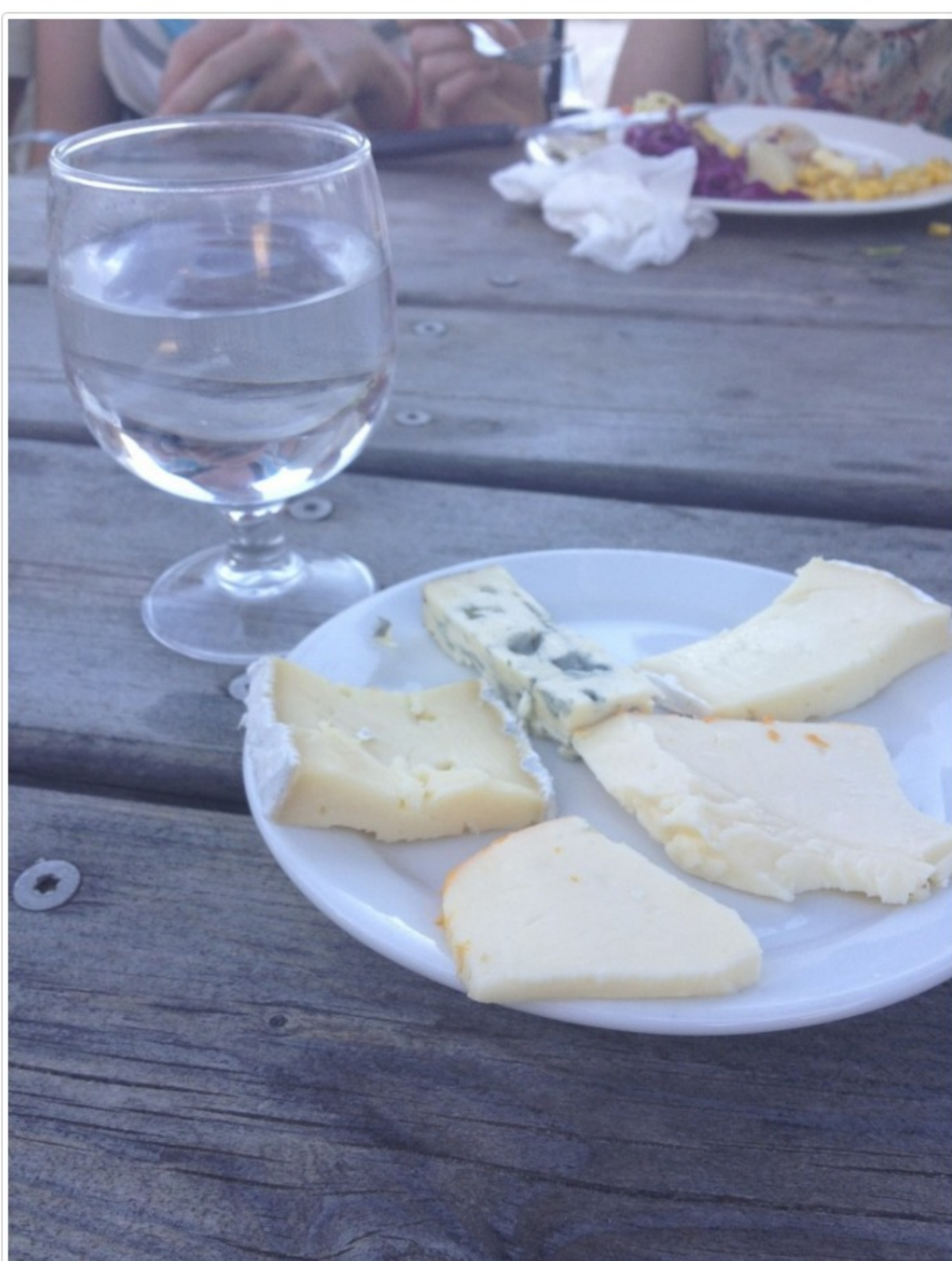
Återkommande efterrätt, ostbricka!

Den 30 augusti släpper UCPA sina vinterresor och då kommer i alla fall jag hänga vid datorn för att boka in en vecka snowboard offpist ! Är du också sugen på en vecka i alperna nästa vinter? Jag har inför vintersäsongen blivit UCPA-ambassadör och kan tack vare det också erbjuda rabatt till mina vänner och bekanta: maila mig om du vill ha en rabattkod på 100 SEK som du kan använda vid din bokning!