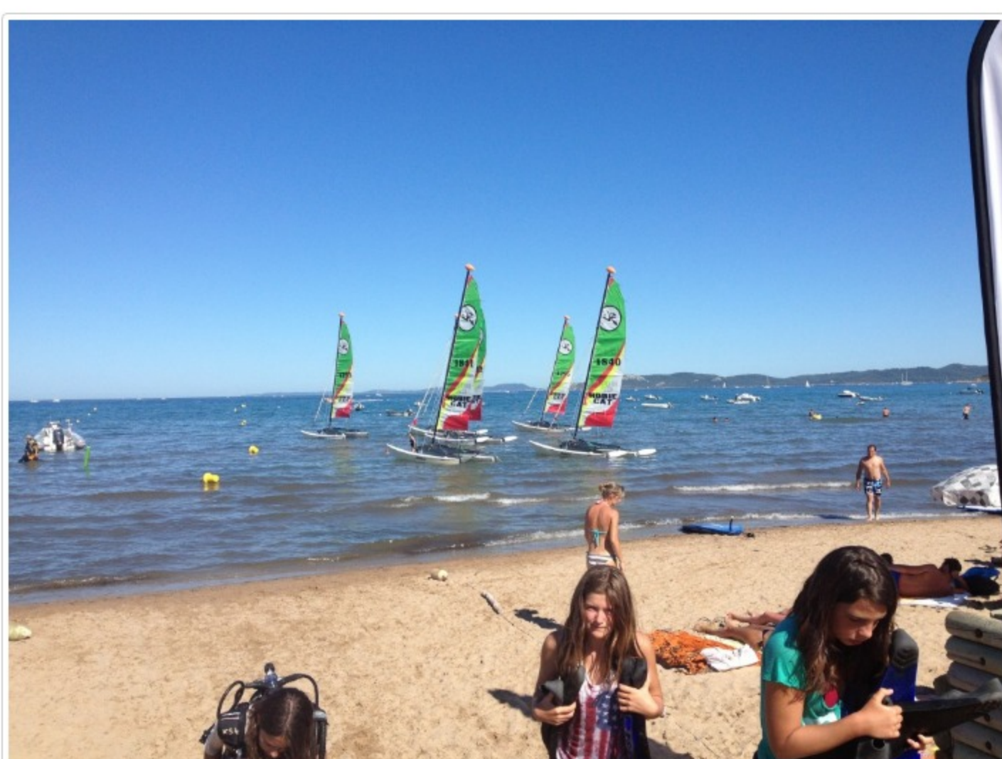
Centrets egna katamaraner väntar på sin besättning!