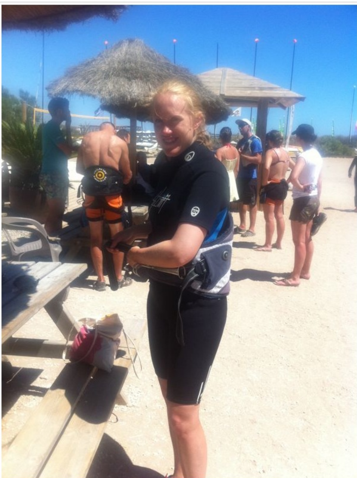
Redo för surfning! Vätträkt eller flytväst är obligatorisk säkerhetsutrustning!